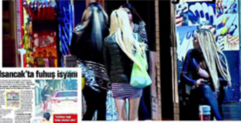
Alsancak'ta fuhuş isyanı